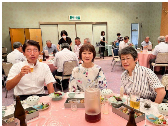
素晴らしい仲間たちとの絆が深まる瞬間