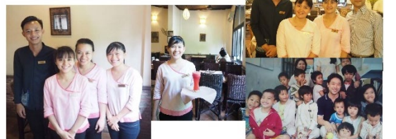
Restaurant HuongLai 人生のチャンスを与えるレストラン (職業訓練、独立支援)

変化が大きな途上国のベトナムと共に人間として成長したいと願った私は留学中に携わったボランティア活動のご縁で孤児院へ通うようになりました。そこで出会った若者達の潜在能力の高さと生きるエネルギーに日に日に感銘を受け、「情熱や潜在的な可能性を秘めた彼らに人生を切り開くチャンスを与えられれば！」という使命にかられ、「英語も出来ない、レストランに行った経験すらない、中学も出ていない、ないない尽くしの若者達も、チャンスさえあれば、英語で外国人に感動を与えるサービスを出れるようになる、一流店で働けるようになる！」と考えました。その願いと使命を実現するために、2001年に個人で開業したトレーニングレストランがフーンライレストランです。